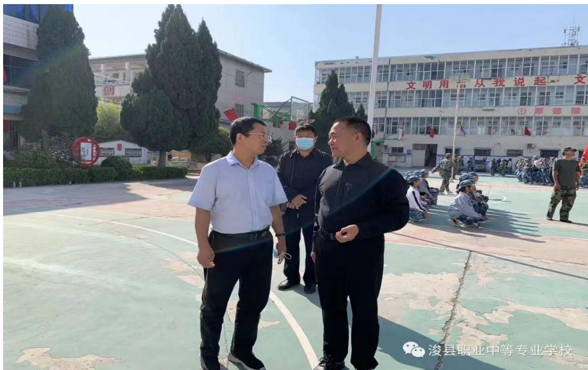
27副县长朱付保到学校调研校园疫情防控及开学工作