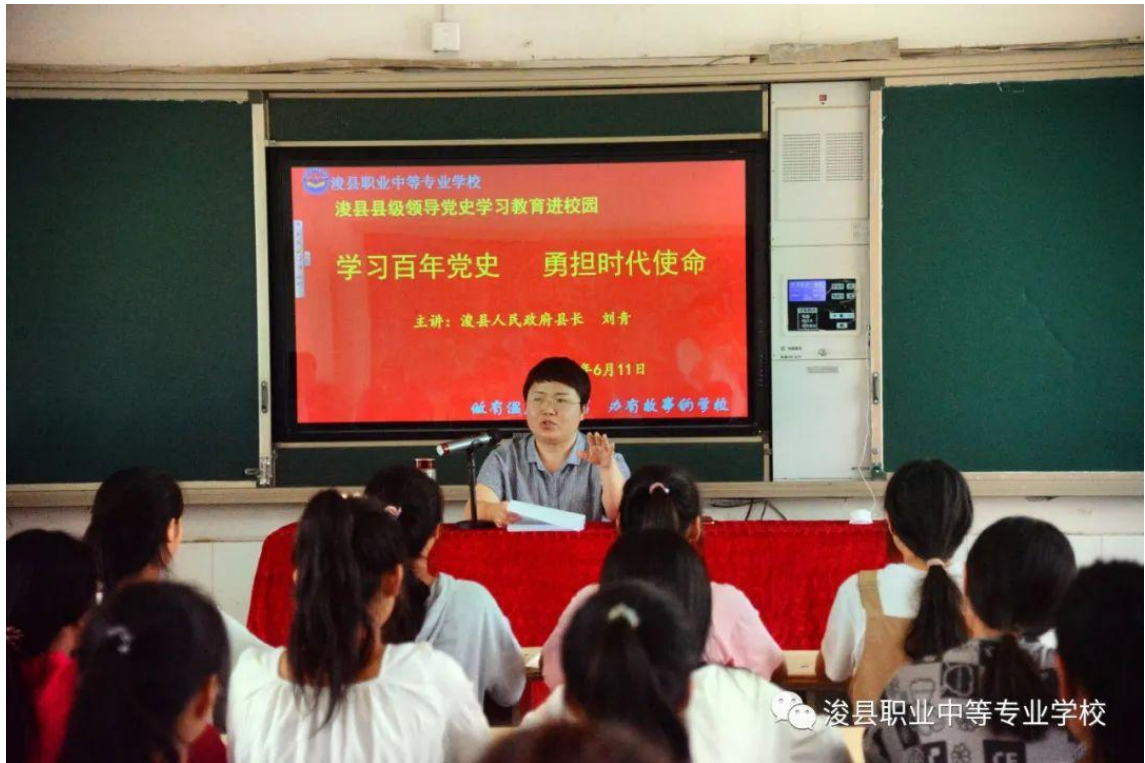
图 3 浚县人民政府县长刘青到校上思政课