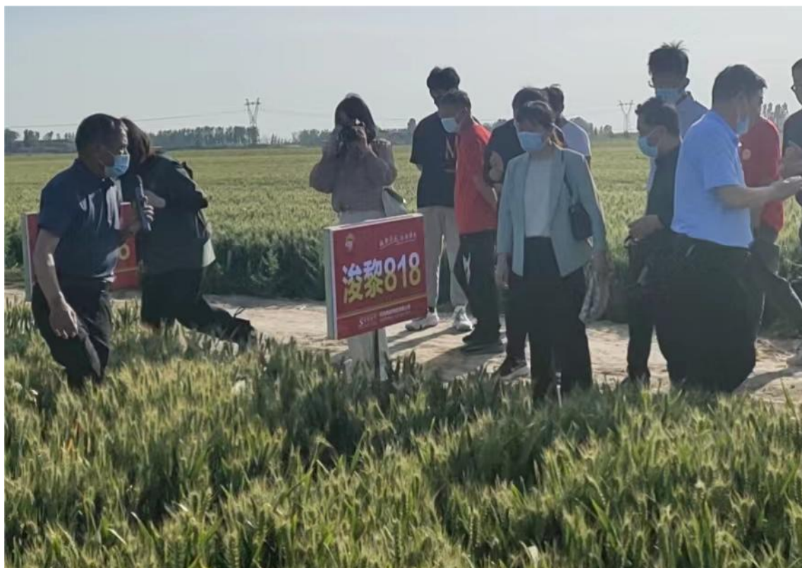
图 17 现代农艺专业处师生在校企共建试验田进行实践教学