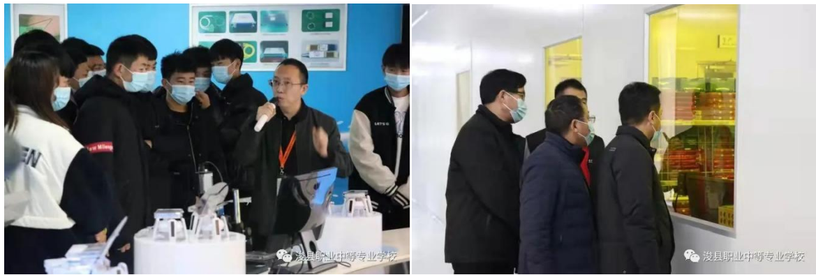
图 21 校企双方共同组织老师和学生代表前往河南仕佳光子公司参观