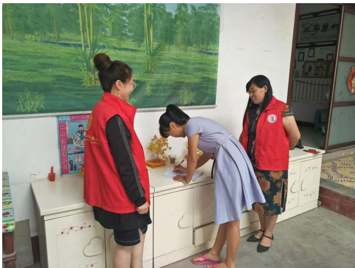
图 25 走村入户排查了解群众需求

2022 年度截止 11 月底，县教体局携浚县职业中专培训共计 1644 人，共计认定 1507 人，取证 1277 人。其中，社会类共计培训 572 人，参加认定 451 人，取证 435 人；学生共计培训 842 人，参加认定 826 人，取证 635 人；教师共计培训 230 人，参加认定 230 人，取证 207 人. 圆满完成了我校的培训任务，为社会提供了大量的家政服务行业急缺的技术人才，满足了社会人才需求，同时增强学员就业机会，提高了学员就业薪资水平。