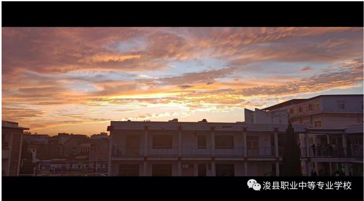
图5 学生摄影作品二