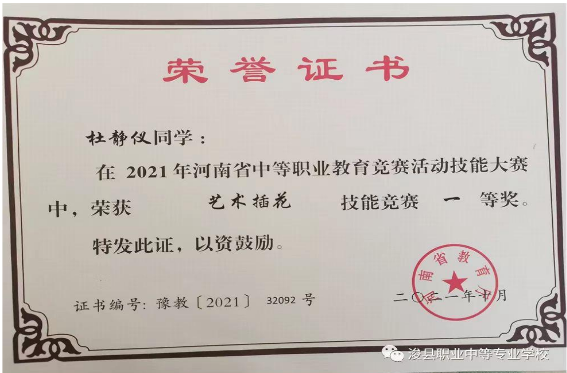
图 13 学生技能大赛获奖证书