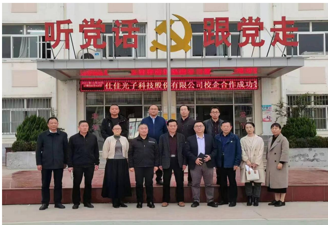
图 16 学校领导与仕佳光子企业领导在校企合作签约仪式上的合影

我校 2022 届毕业生 878 人，截至 2022 年 12 月 27 日，毕业去向落实率为 100%。一次就业率 96.8%，对口就业率 92.6%，创业率 3.6%，获得双证人数 631 人，双证获得率 71.8%开展职业培训 842 人次，平均起薪 1982 元，企业满意率 85.7%。