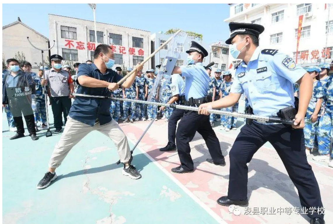
图 11 防暴反恐演练

通过此次演练活动，既传授了师生遇到恐怖暴力袭击时紧急避难的技能，又对警民联手反恐防暴的配合方法和熟练度进行了磨炼和提升，进一步确保了校园环境的和谐稳定，有效推动了学校反恐防暴安全工作的扎实推进。