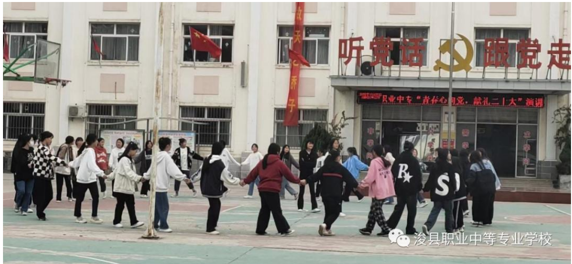
图9 封校期间学生在校课外活动