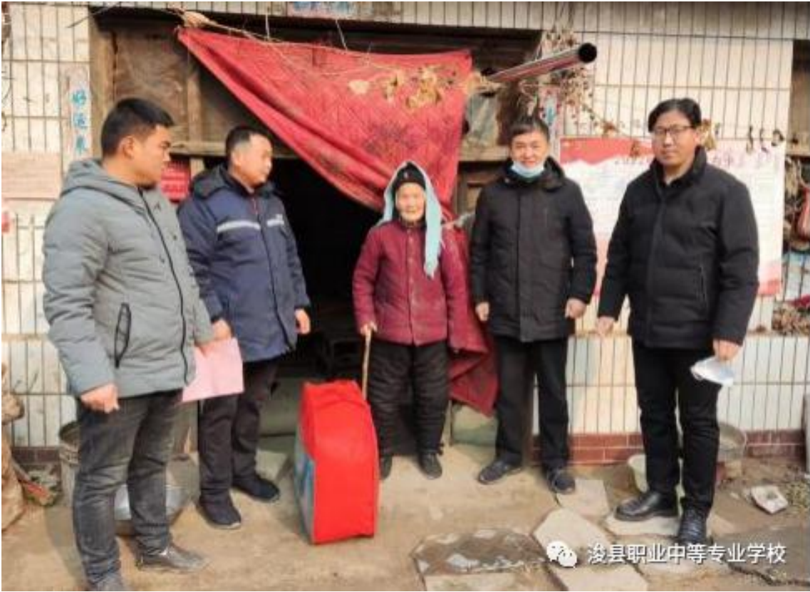
图1 向所驻村群众赠送过冬物品