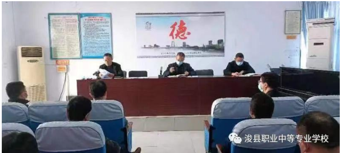
图 10 校领导召开防范化解安全隐患专项治理 暨第十三次疫情防控工作会议