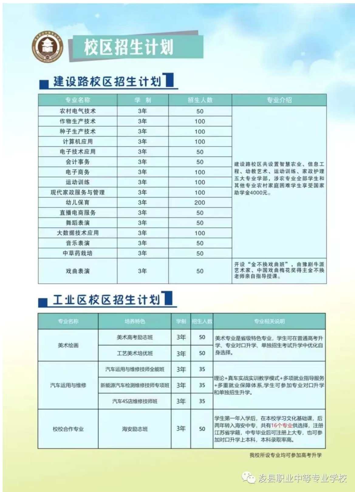
表 5 2022-2023 学年专业招生表