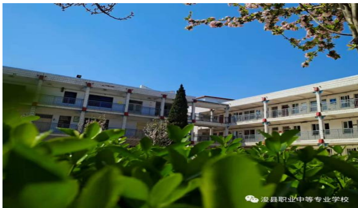
图4 学生摄影作品一

学生们在活动中尽享书画之快乐，体验艺术之魅力，展现出乐观开朗的精神风貌和时代特征。此次活动更好地营造了健康、文明、高雅、和谐的校园文化氛围，进一步提升了校园文化层次和品位，实现了活动育人、环境育人、文化育人。