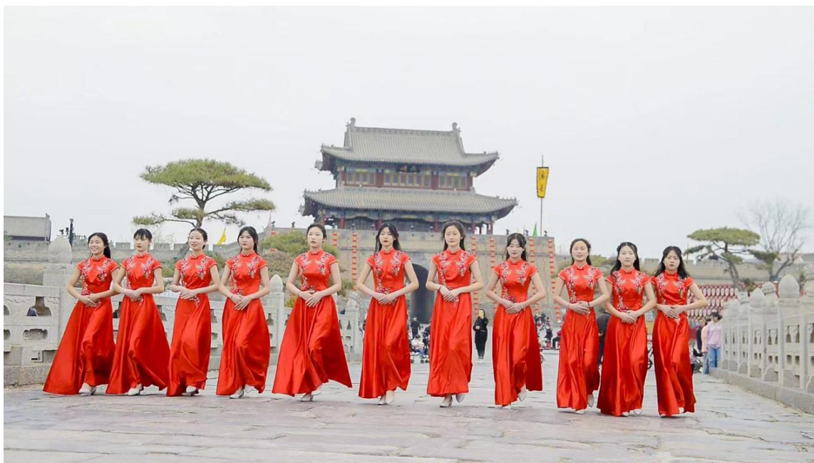
图 15 礼仪社团参加古城活动