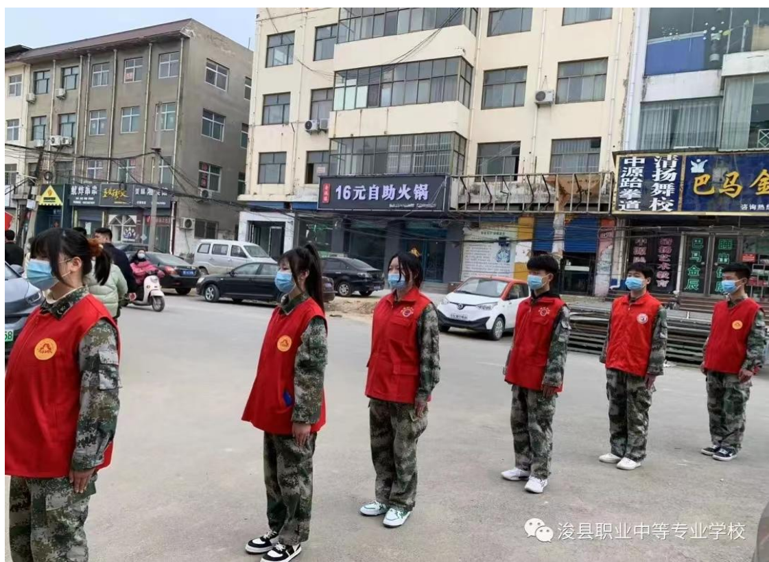
图 30 学校组织疫情防控工作演练图