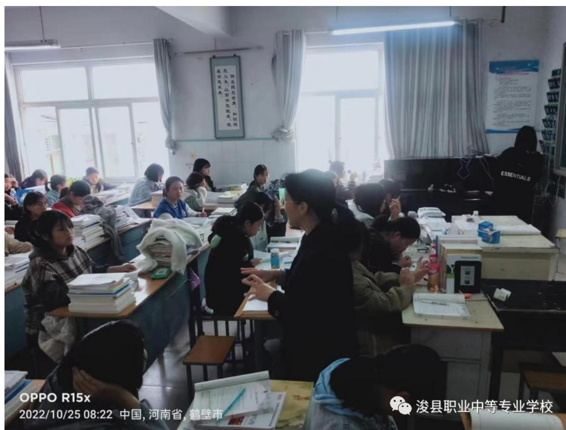
图8 封校期间学生上课

封校期间，我校高度重视和关注学生的课堂学习和生活情况，通过线上网课和线下课堂相结合的方式，组织好课堂教育教学。班主任也积极利用好家校沟通平台，和同学们多谈话，多交心，及时关注学生学习生活、心理健康情况。多样化的课堂，让学生们的不良情绪有处安放，有效缓解学生学习压力，在疫情封校期间能安心学习。疫情是一场无声的大考，我校在关心学生学习生活的同时，也将持续关注学生们的心理健康，用润物细无声的关爱，安抚呵护学子们波动的内心。