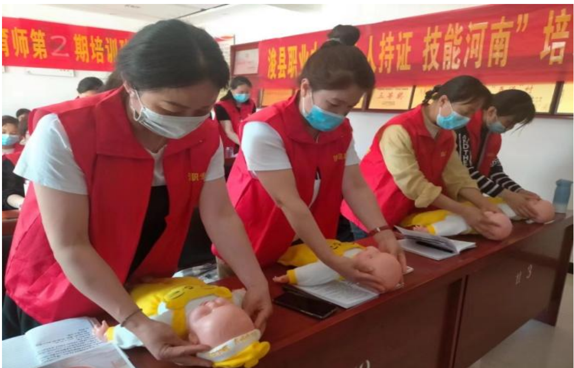
图 24 生动活泼的实操课堂