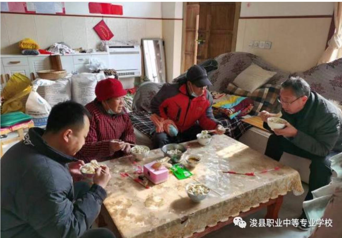
图2 开展“与驻村群众同吃一顿饭”活动