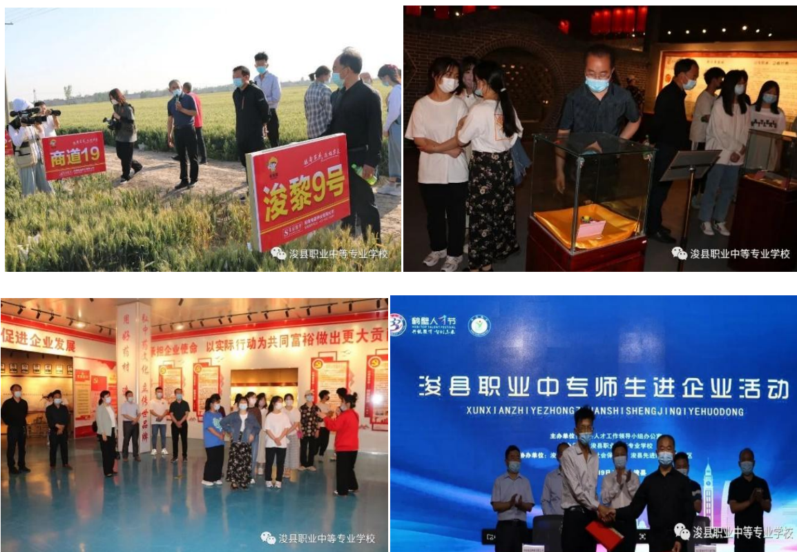
图 22 我校师生进企业