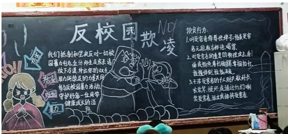
图 26 校园欺凌宣传