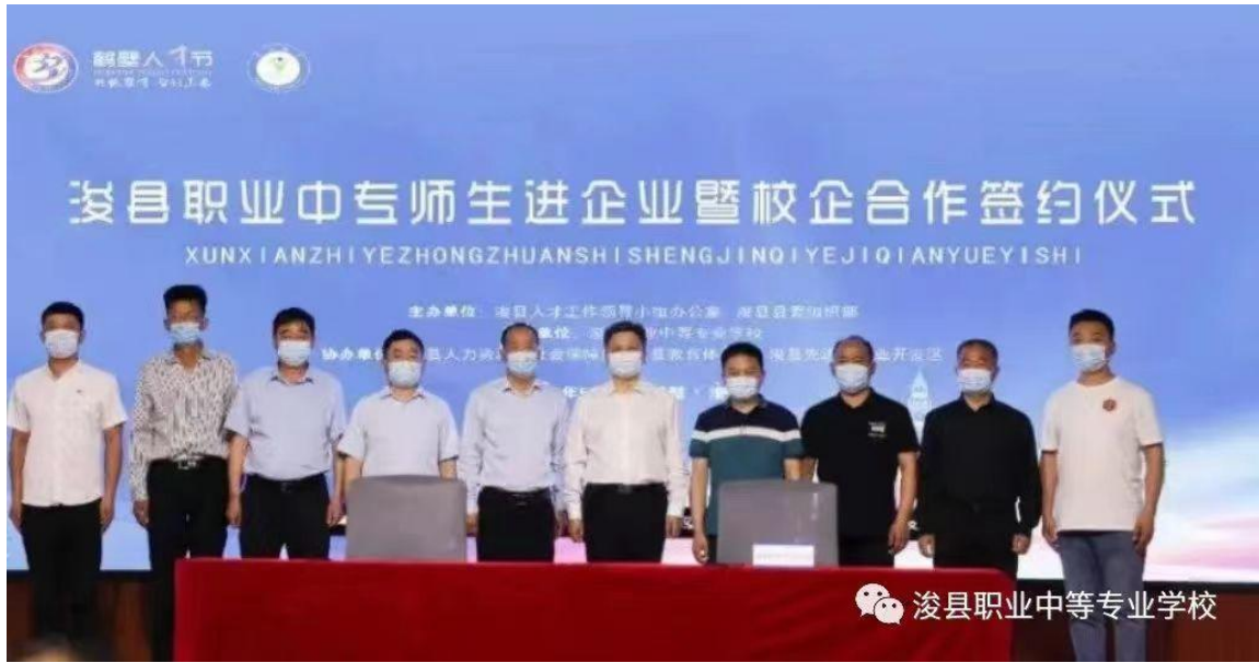
图 12 校企合作签约仪式