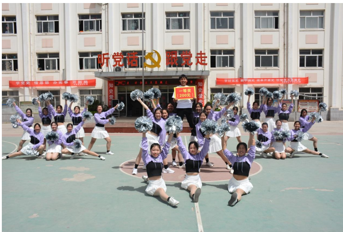
图 14 舞蹈社团在学校比赛中获奖

近几年来，我校社团活动始终坚持从学生兴趣出发，结合学校日常教学工作，因势利导，活动经常化、多样化，学校体育、艺术 2+1 活动蓬勃开展。如小歌手比赛、校园集体舞展示、书画比赛等，为学生提供了许多自我展示的机会。在众多的社团中，音乐、鼓乐、舞蹈社团是相对突出的 3 个。