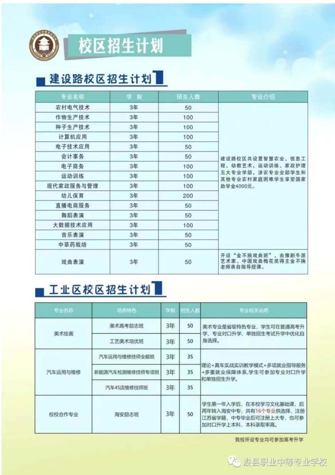
表 5 2022-2023 学年专业招生表